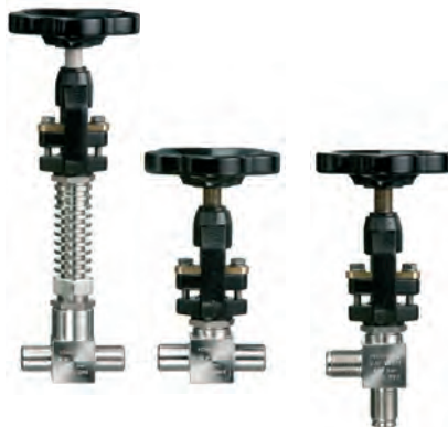
Thiedig Sampling and analysing systems