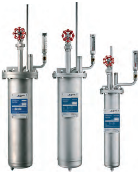
Hochdruckventile | High-pressure valves